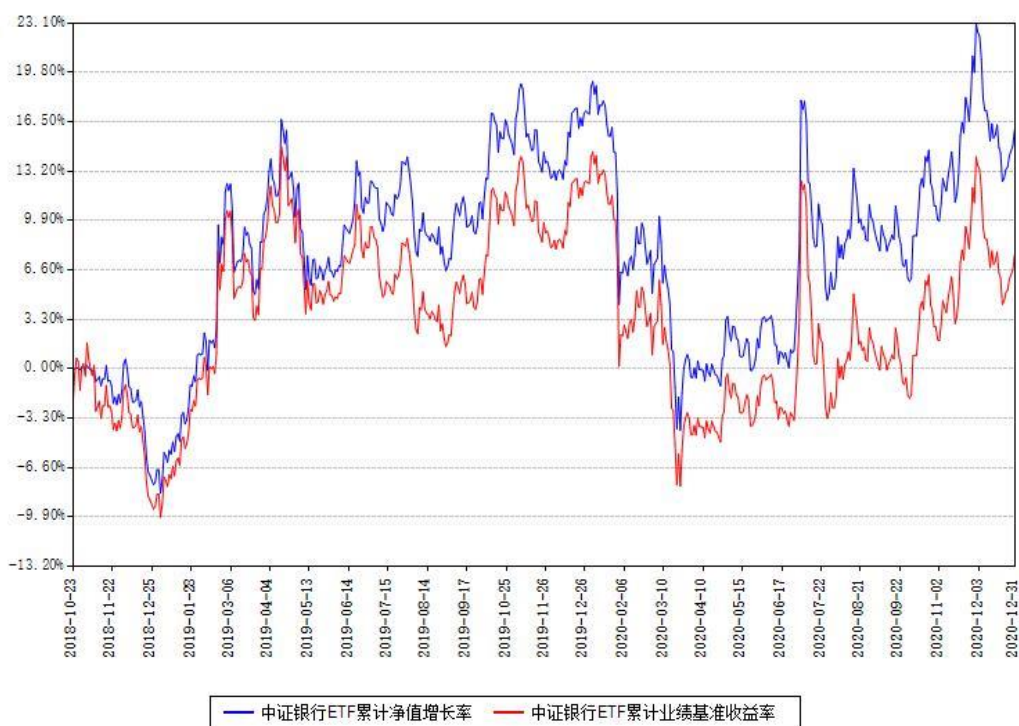
中证银行ETF累计净值增长率与同期业绩比较基准收益率对比图

注：本基金建仓期为本《基金合同》生效之日（2018年10月23日）起6个月，建仓期结束时各项资产配置比例符合合同约定。