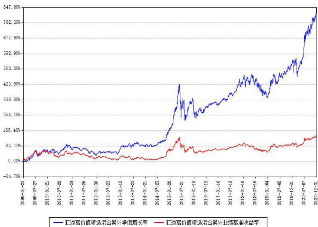
汇添富价值精选混合累计净值增长率与同期业绩比较基准收益率对比图

注：本基金建仓期为本《基金合同》生效之日（2009年01月23日）起6个月，建仓期结束时各项资产配置比例符合合同约定。