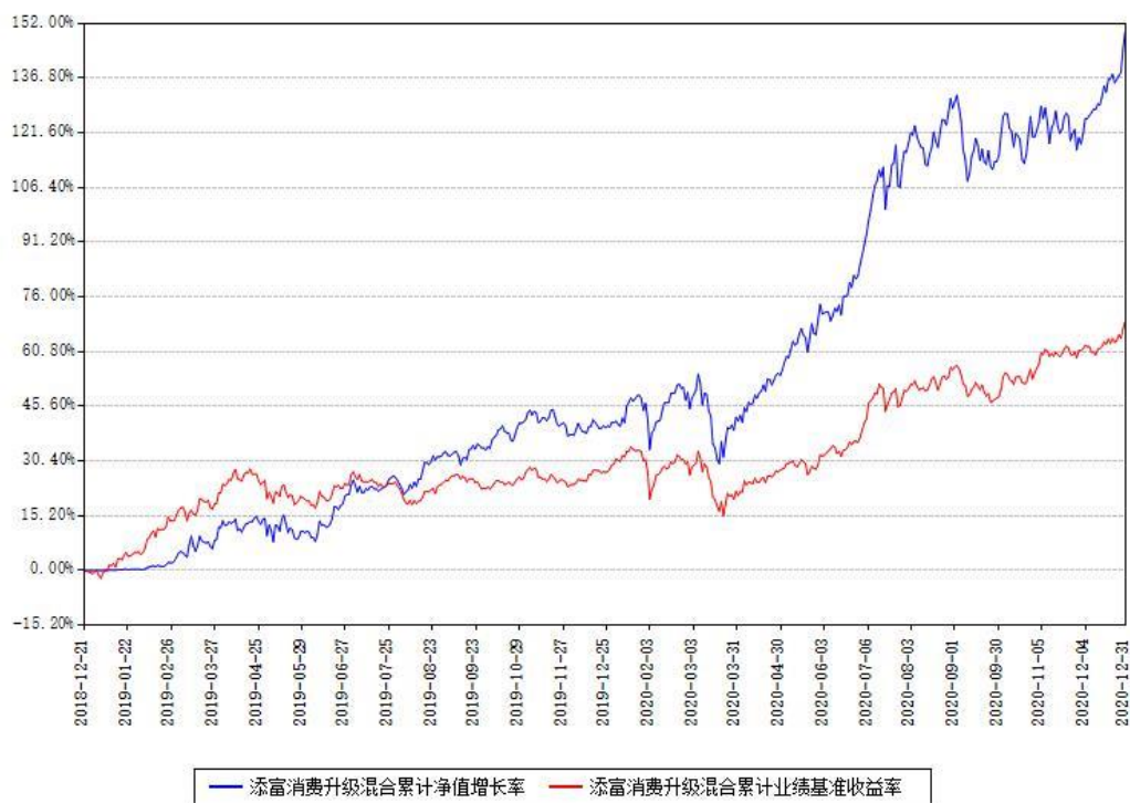
添富消费升级混合累计净值增长率与同期业绩基准收益率对比图

注：本基金建仓期为本《基金合同》生效之日（2018年12月21日）起6个月，建仓期结束时各项资产配置比例符合合同约定。