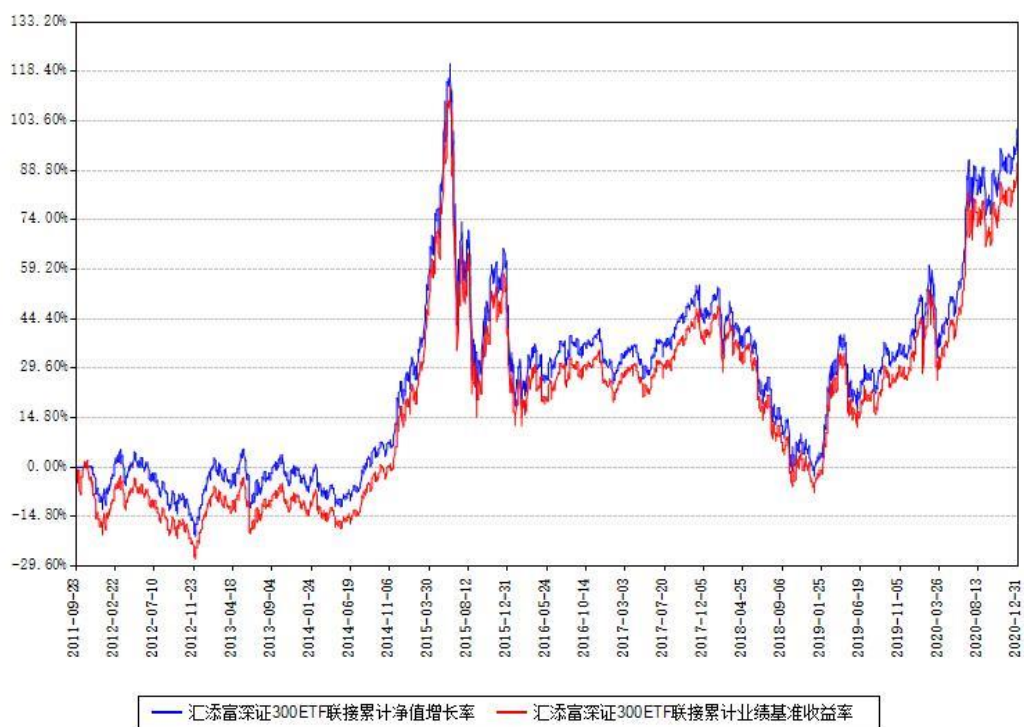
汇添富深证300ETF联接累计净值增长率与同期业绩基准收益率对比图

注：本基金建仓期为本《基金合同》生效之日（2011年09月28日）起6个月，建仓期结束时各项资产配置比例符合合同约定。