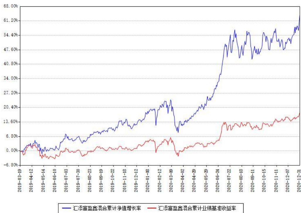
汇添富盈鑫混合累计净值增长率与同期业绩基准收益率对比图

注：本基金建仓期为本《基金合同》生效之日（2019年03月19日）起6个月，建仓期结束时各项资产配置比例符合合同约定。