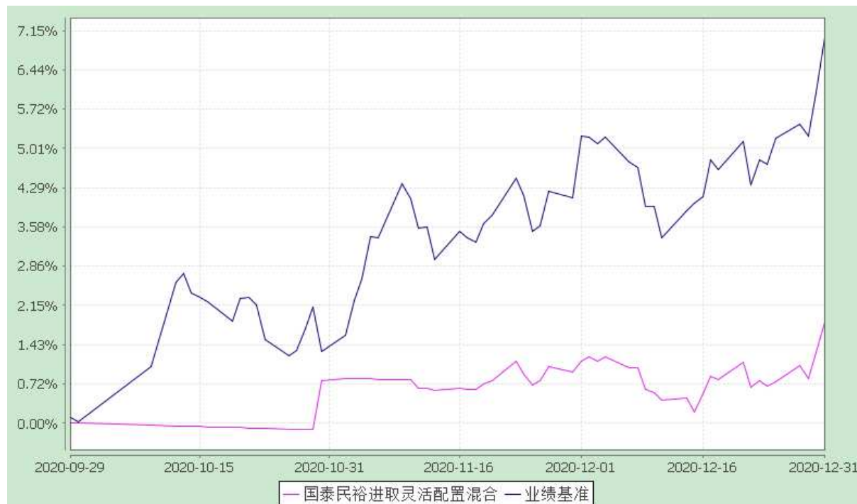
自基金合同生效以来份额累计净值增长率与业绩比较基准收益率的历史走势对比图 (2020 年 9 月 29 日至 2020 年 12 月 31 日)

注：（1）本基金合同生效日为 2020 年 9 月 29 日，截止至 2020 年 12 月 31 日，本基金运作时间未满一年；