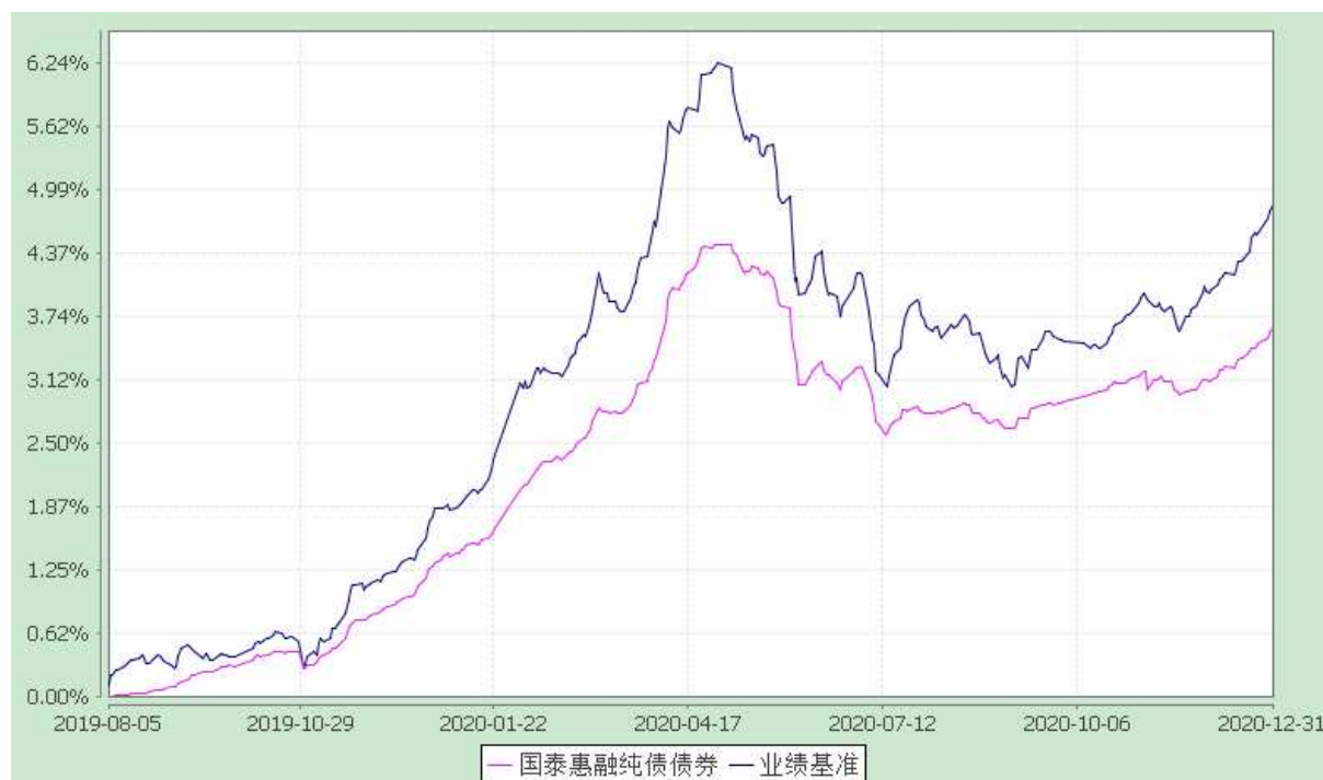
自基金合同生效以来份额累计净值增长率与业绩比较基准收益率的历史走势对比图 (2019 年 8 月 5 日至 2020 年 12 月 31 日)

注：本基金合同生效日为 2019 年 8 月 5 日。本基金在六个月建仓期结束时，各项资产配置比例符合合同约定。