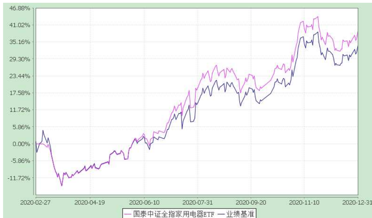
自基金合同生效以来份额累计净值增长率与业绩比较基准收益率的历史走势对比图 (2020 年 2 月 27 日至 2020 年 12 月 31 日)

注：1、本基金的合同生效日为 2020 年 2 月 27 日，截止至 2020 年 12 月 31 日，本基金运作时间未满一年；