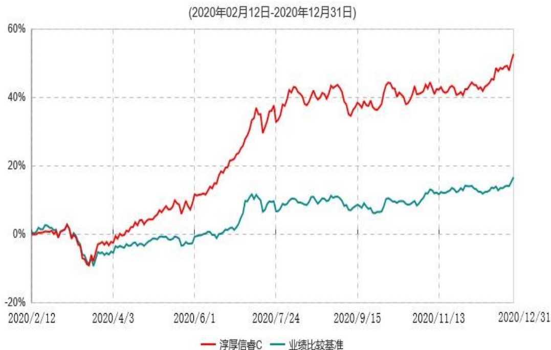
淳厚信睿C累计净值增长率与业绩比较基准收益率历史走势对比图

注：本基金基金合同生效日为 2020 年 2 月 12 日，至报告期末未满 1 年。按基金合同规定，本基金自基金合同生效起 6 个月为建仓期，建仓期结束时各项资产配置比例符合基金合同约定。