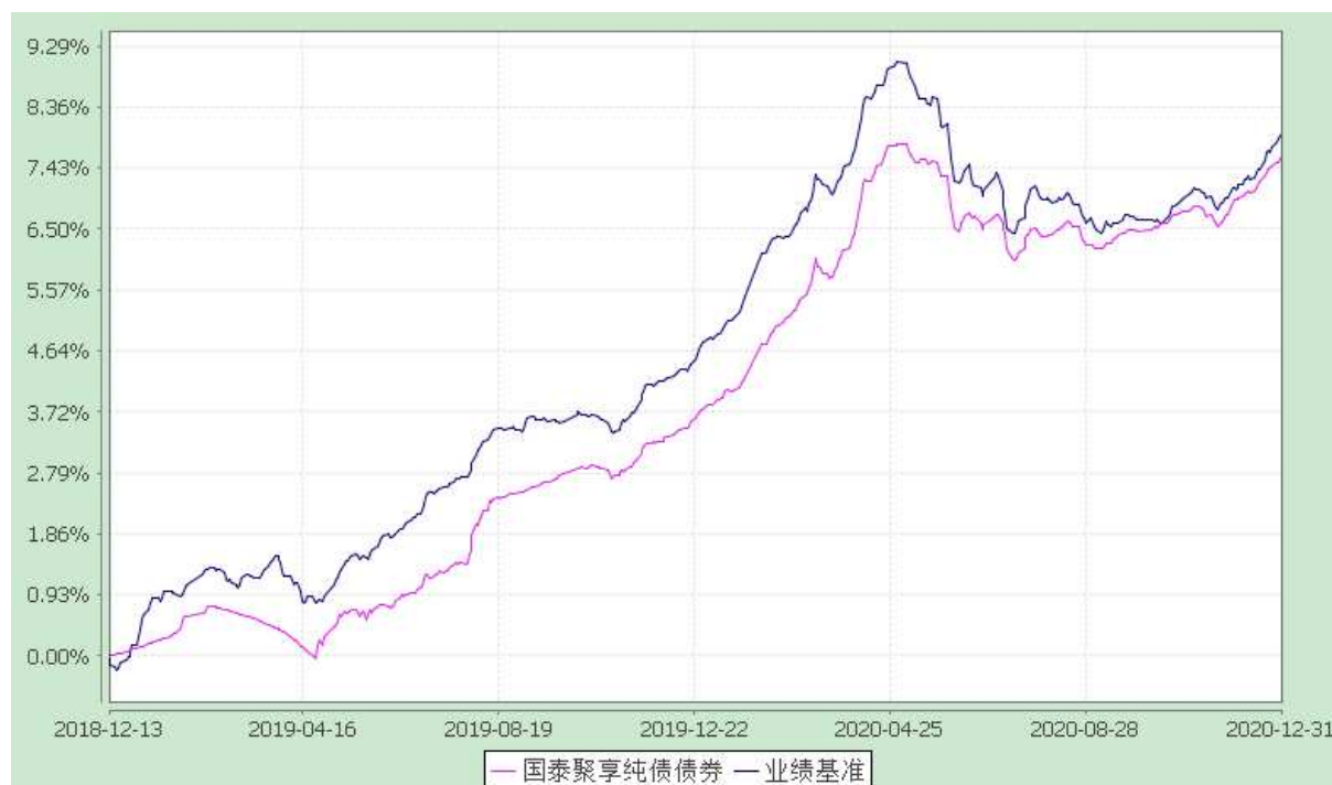
自基金合同生效以来份额累计净值增长率与业绩比较基准收益率的历史走势对比图 (2018 年 12 月 13 日至 2020 年 12 月 31 日)

注：本基金合同生效日为 2018 年 12 月 13 日。本基金在六个月建仓期结束时，各项资产配置比例符合合同约定。