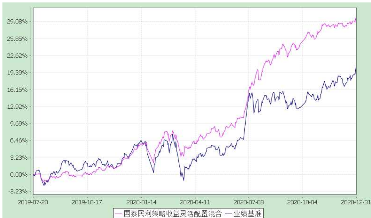
自基金合同生效以来份额累计净值增长率与业绩比较基准收益率的历史走势对比图 (2019 年 7 月 20 日至 2020 年 12 月 31 日)