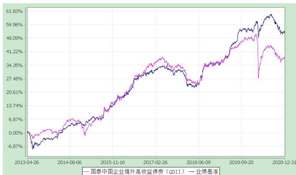
国泰中国企业境外高收益债券型证券投资基金 自基金合同生效以来份额累计净值增长率与业绩比较基准收益率历史走势对比图 (2013 年 4 月 26 日至 2020 年 12 月 31 日)

注：（1）本基金的合同生效日为 2013 年 4 月 26 日。本基金在六个月建仓期结束时，各项资产