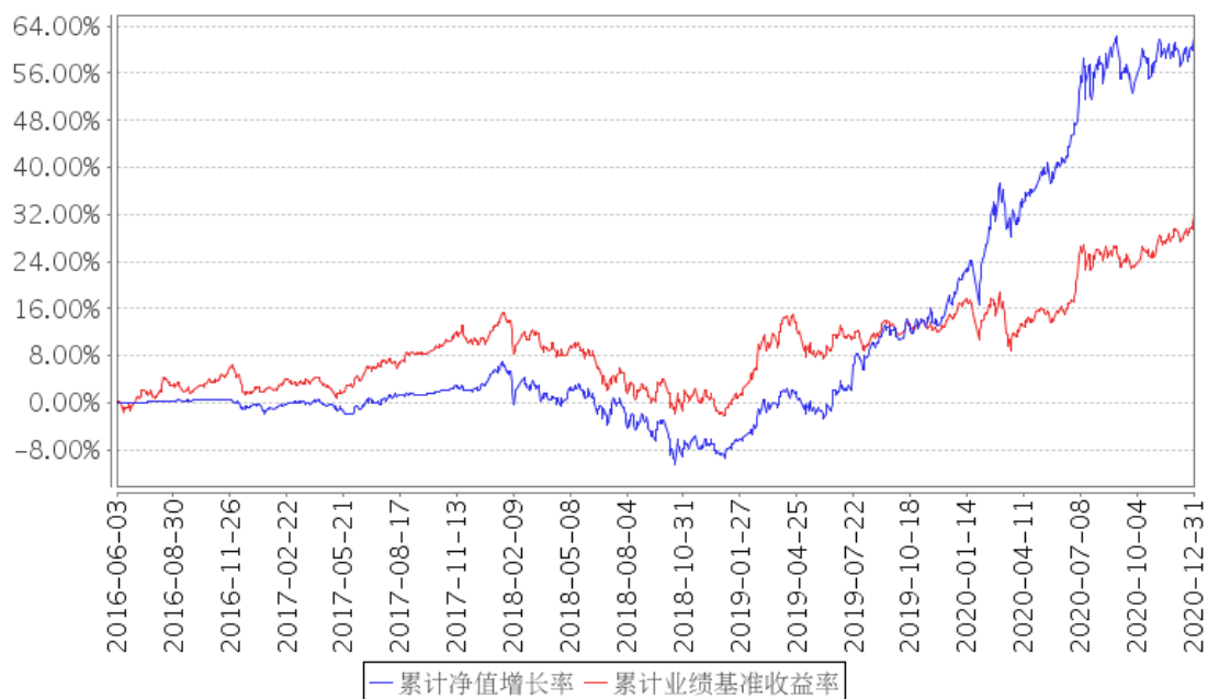
招商增荣混合累计净值增长率与同期业绩比较基准收益率的历史走势对比图