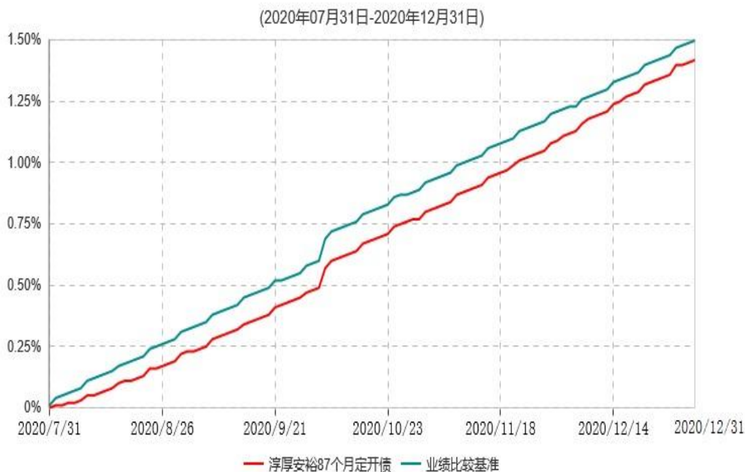
淳厚安裕87个月定期开放债券型证券投资基金累计净值增长率与业绩比较基准收益率历史走势对比图

注：本基金基金合同生效日为2020年7月31日，至报告期末未满1年。按基金合同规定，本基金自基金合同生效起6个月为建仓期，本报告期处于建仓期内。