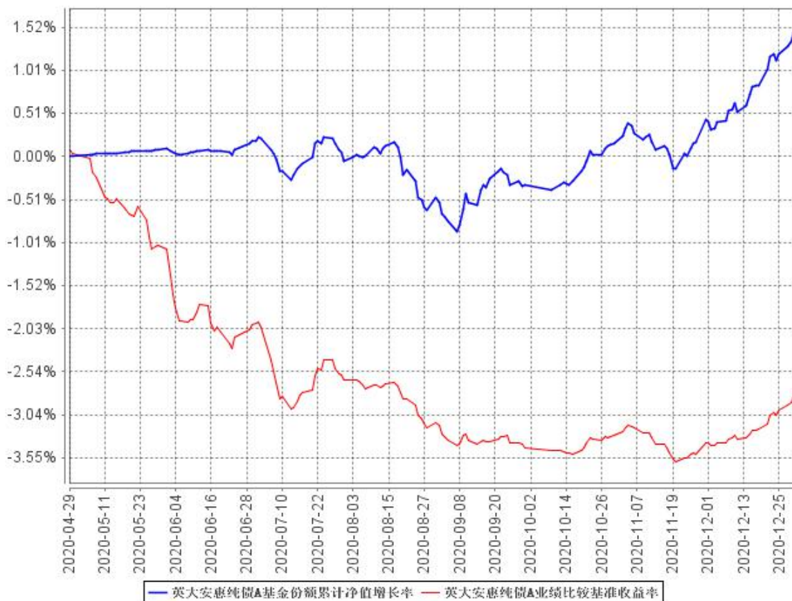
英大安惠纯债A基金份额累计净值增长率与同期业绩比较基准收益率的历史走势对比图