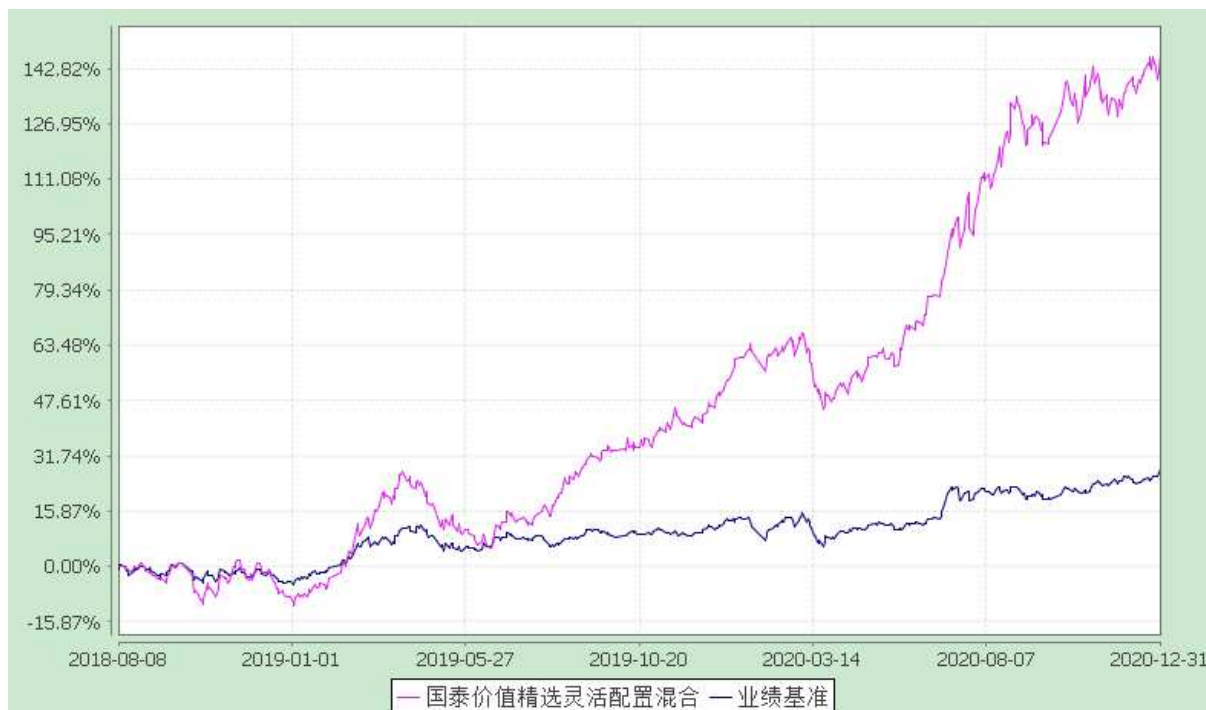
自基金合同生效以来份额累计净值增长率与业绩比较基准收益率的历史走势对比图 (2018 年 8 月 8 日至 2020 年 12 月 31 日)

注：本基金合同生效日为 2018 年 8 月 8 日，在 6 个月建仓期结束时，各项资产配置比例符合合同约定。