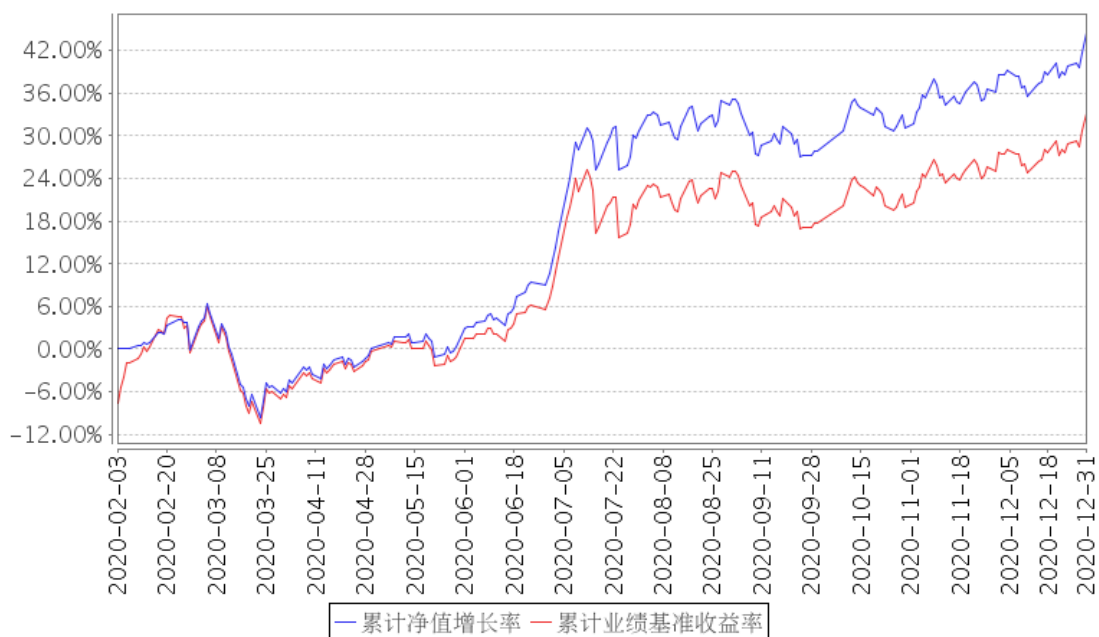
MSCICHNA 累计净值增长率与同期业绩比较基准收益率的历史走势对比图

注：本基金合同于 2020 年 2 月 3 日生效，截至本报告期末基金成立未满一年；自基金成立之日起 6 个月内为建仓期，建仓期结束时各项资产配置比例符合合同约定。