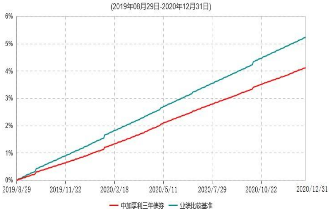
中加享利三年定期开放债券型证券投资基金累计净值增长率与业绩比较基准收益率历史走势对比图

注：1、本基金基金合同于2019年8月29日生效，截至本报告期末，本基金合同生效已满一年。