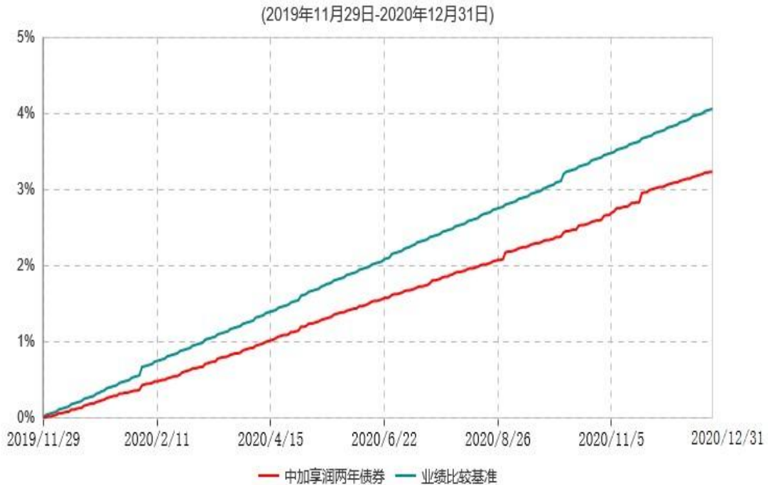
中加享润两年定期开放债券型证券投资基金累计净值增长率与业绩比较基准收益率历史走势对比图

注：1.本基金的基金合同于2019年11月29日生效，截至本报告期末，本基金合同生效已满一年。