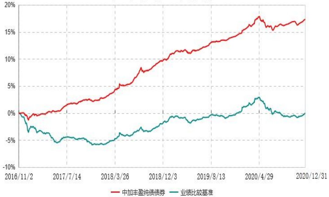
中加丰盈纯债债券型证券投资基金累计净值增长率与业绩比较基准收益率历史走势对比图 (2016年11月02日-2020年12月31日)