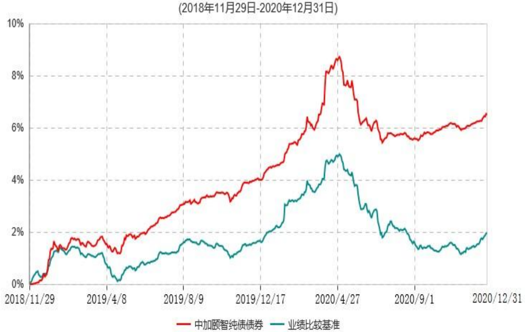
中加颐智纯债债券型证券投资基金累计净值增长率与业绩比较基准收益率历史走势对比图