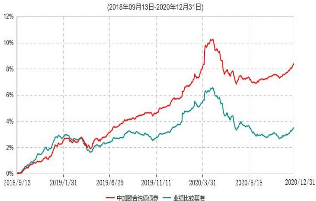
中加颐合纯债债券型证券投资基金累计净值增长率与业绩比较基准收益率历史走势对比图