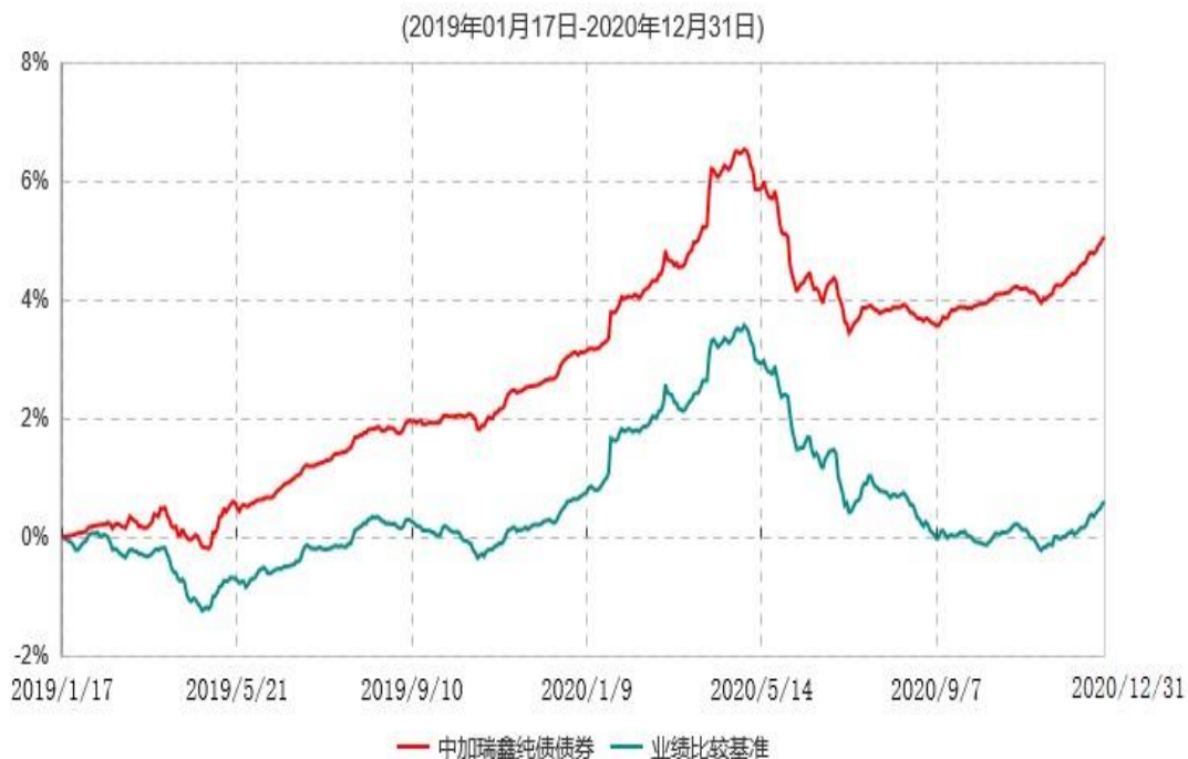
中加瑞鑫纯债债券型证券投资基金累计净值增长率与业绩比较基准收益率历史走势对比图

注：1.本基金基金合同于 2019年 1月 17日生效，截至本报告期末，本基金基金合同生效已满一年。