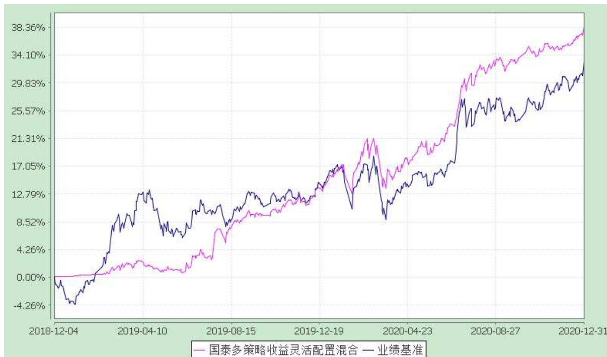
自基金转型以来份额累计净值增长率与业绩比较基准收益率的历史走势对比图 (2018 年 12 月 4 日至 2020 年 12 月 31 日)