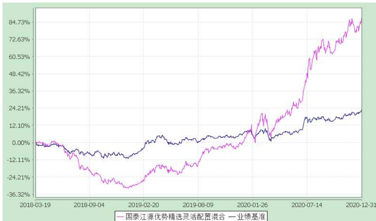
自基金合同生效以来份额累计净值增长率与业绩比较基准收益率的历史走势对比图 (2018 年 3 月 19 日至 2020 年 12 月 31 日)

注：本基金合同生效日为 2018 年 3 月 19 日。本基金在 6 个月建仓期结束时，各项资产配置比例符合合同约定。