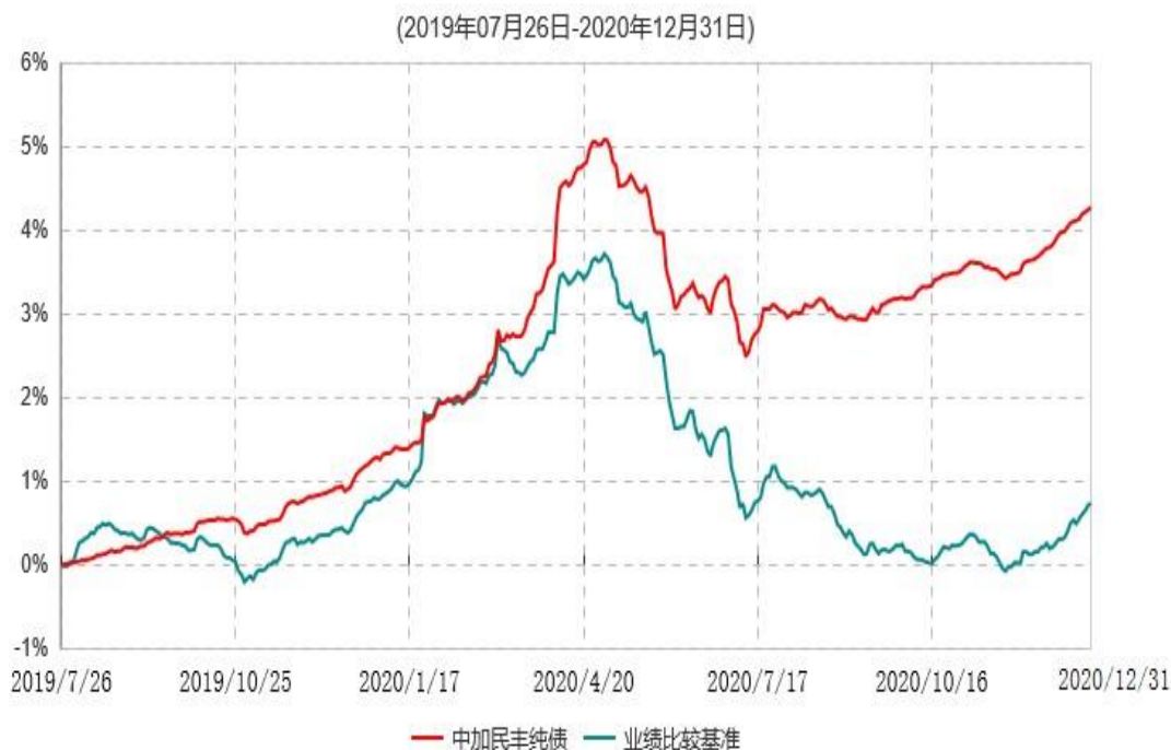
中加民丰纯债债券型证券投资基金累计净值增长率与业绩比较基准收益率历史走势对比图

注：1、本基金基金合同于2019年7月26日生效，截止报告期末，本基金的基金合同生效已满一年。