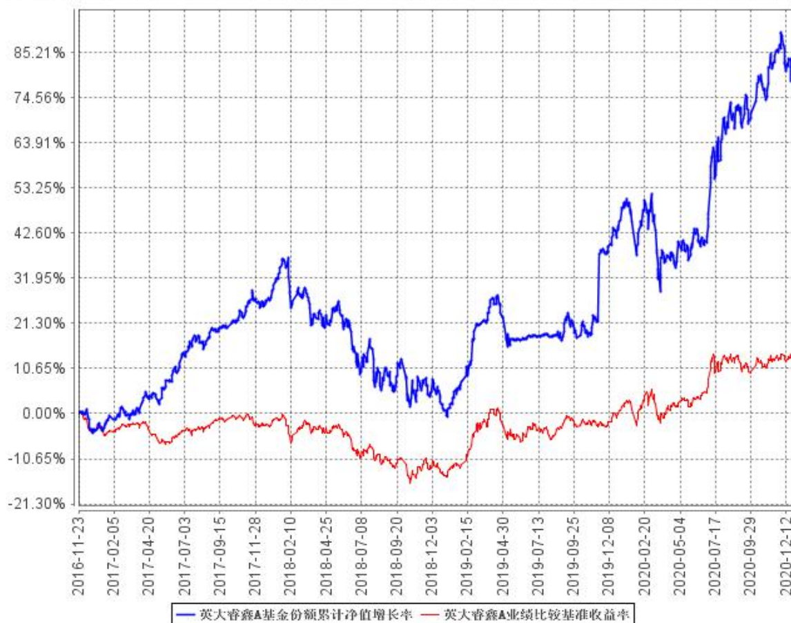
英大睿鑫A基金份额累计净值增长率与同期业绩比较基准收益率的历史走势对比图