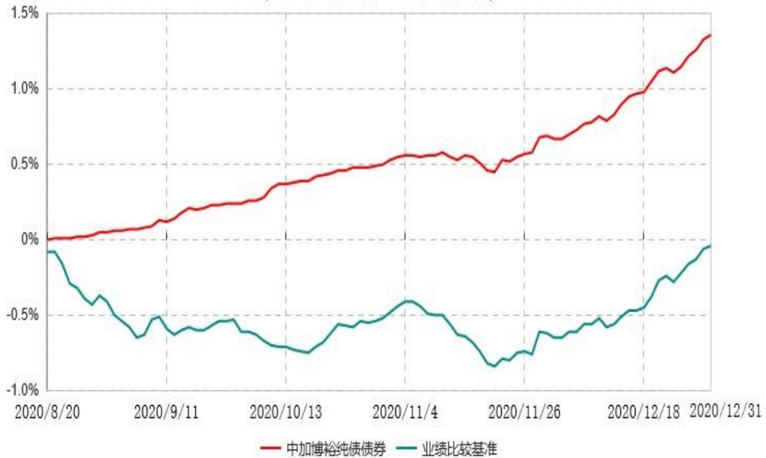
中加博裕纯债债券型证券投资基金累计净值增长率与业绩比较基准收益率历史走势对比图 (2020年08月20日-2020年12月31日)