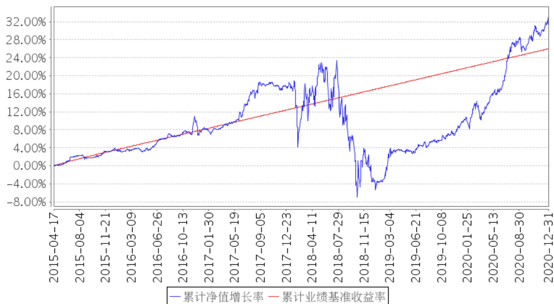
招商丰泰灵活配置混合（LOF）累计净值增长率与同期业绩比较基准收益率的历史走势对比图