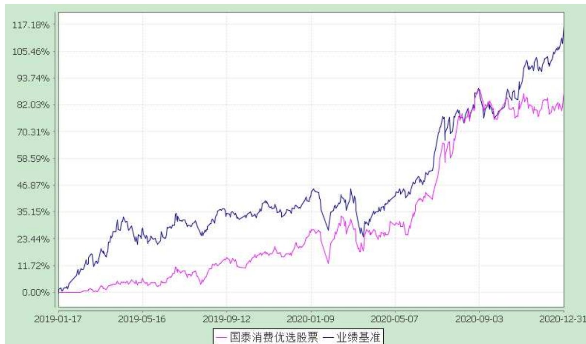
自基金合同生效以来份额累计净值增长率与业绩比较基准收益率的历史走势对比图 (2019 年 1 月 17 日至 2020 年 12 月 31 日)

注：本基金合同生效日为 2019 年 1 月 17 日。本基金在六个月建仓期结束时，各项资产配置比例符合合同约定。