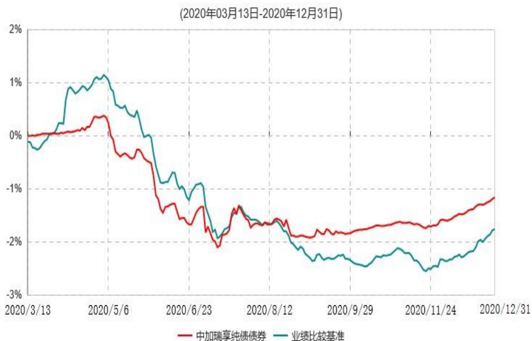
中加瑞享纯债债券型证券投资基金累计净值增长率与业绩比较基准收益率历史走势对比图

注：1、本基金基金合同于2020年3月13日生效，截止报告期末，本基金的基金合同生效未满一年。