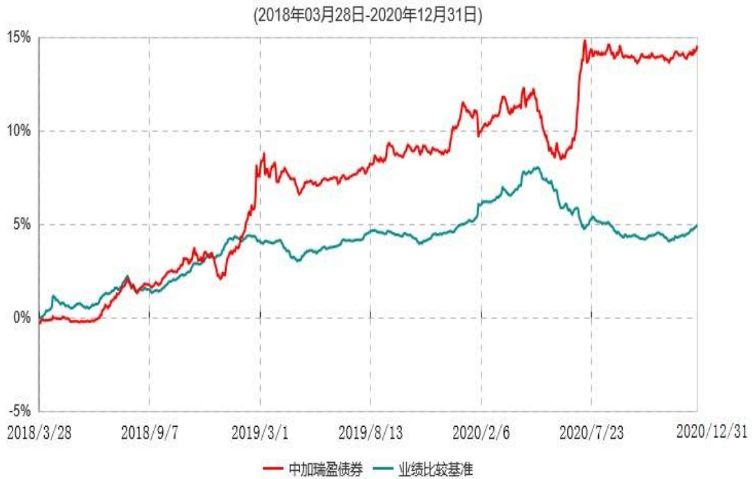
中加瑞盈债券型证券投资基金累计净值增长率与业绩比较基准收益率历史走势对比图