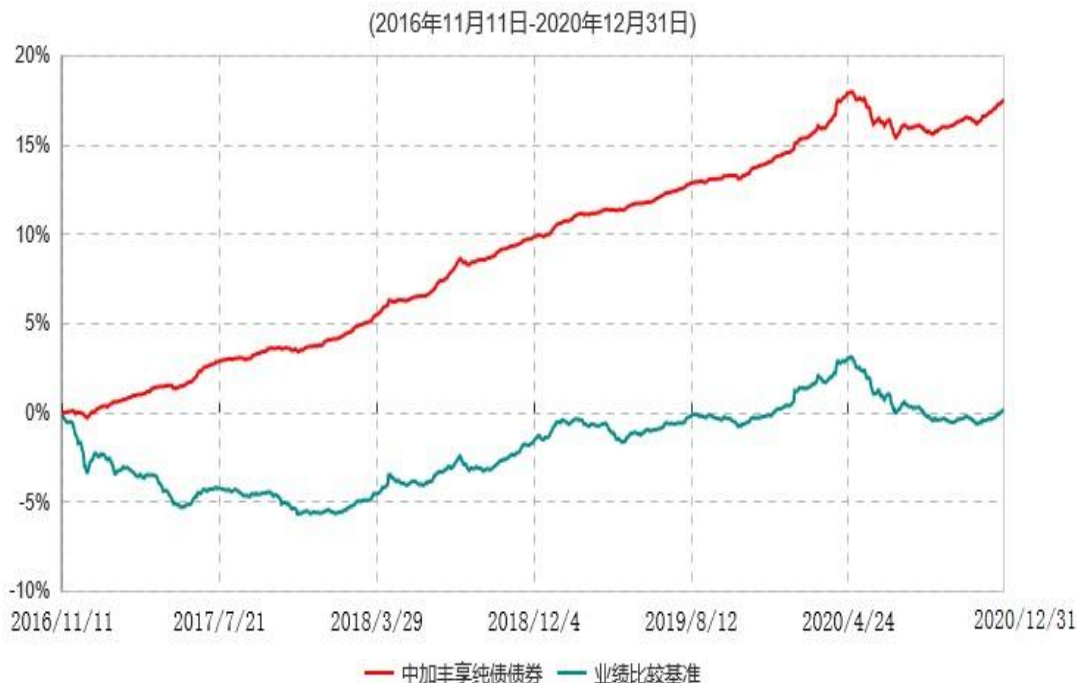
中加丰享纯债债券型证券投资基金累计净值增长率与业绩比较基准收益率历史走势对比图