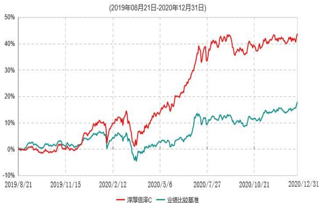
淳厚信泽C累计净值增长率与业绩比较基准收益率历史走势对比图

注：1) 本基金合同于 2019 年 8 月 21 日生效。 2) 按照本基金的基金合同规定，基金管理人应当自基金合同生效之日起六个月内使基金的投资组合比例符合基金合同的约定，截至本报告期末本基金已完成建仓，建仓期结束时各项资产配置比例符合合同约定。