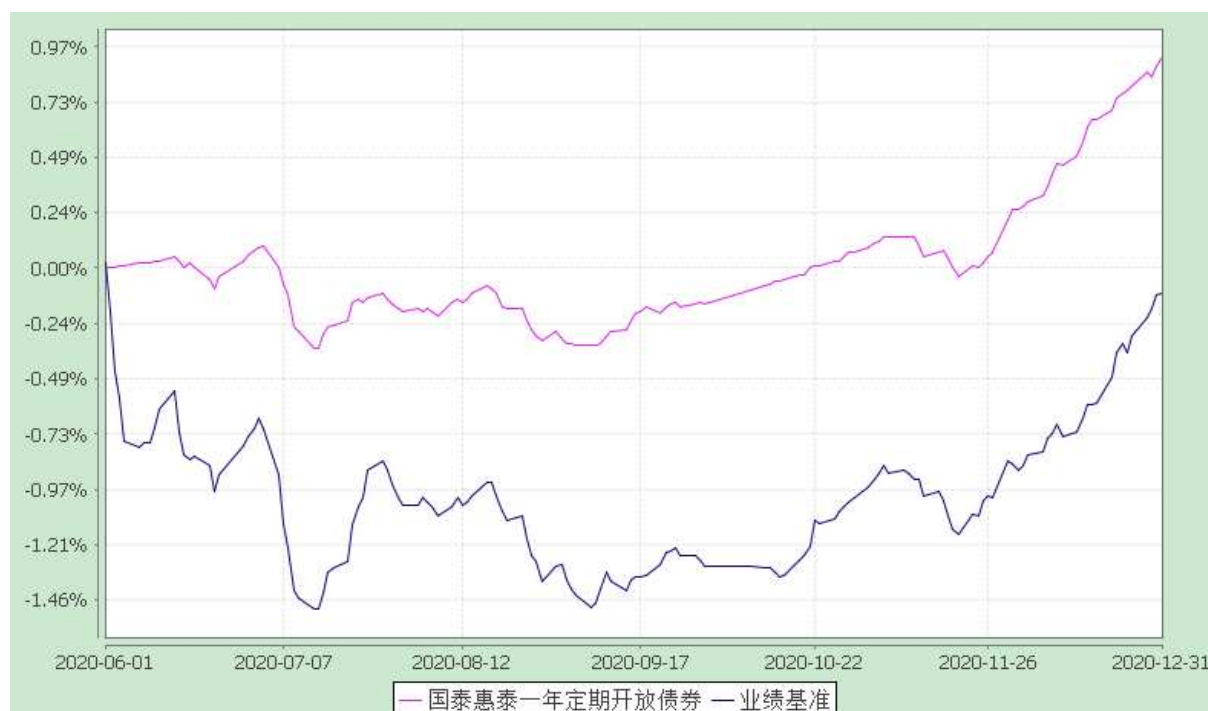
自基金合同生效以来份额累计净值增长率与业绩比较基准收益率的历史走势对比图 (2020 年 6 月 1 日至 2020 年 12 月 31 日)

注：（1）本基金合同生效日为 2020 年 6 月 1 日，截止到 2020 年 12 月 31 日，本基金成立尚未满一年。