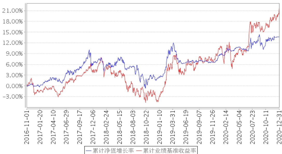
建信瑞丰添利混合A累计净值增长率与同期业绩比较基准收益率的历史走势对比图