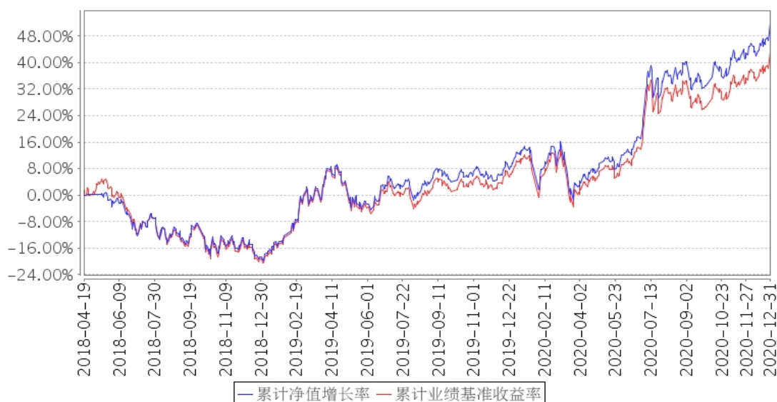
建信MSCI中国A股国际通ETF累计净值增长率与同期业绩比较基准收益率的历史走势对比图