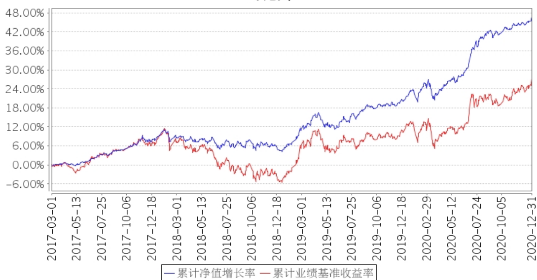
建信鑫瑞回报灵活配置混合累计净值增长率与同期业绩比较基准收益率的历史走势对比图