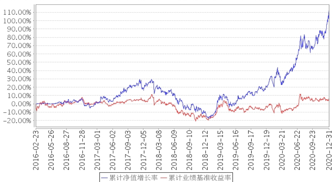
建信现代服务业股票累计净值增长率与同期业绩比较基准收益率的历史走势对比图