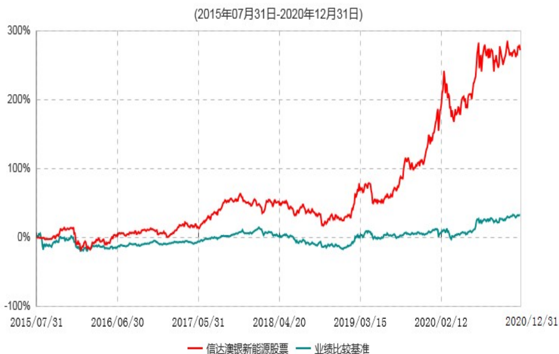
信达澳银新能源产业股票型证券投资基金累计净值增长率与业绩比较基准收益率历史走势对比图

注：1、本基金基金合同于2015年7月31日生效，2015年8月25日开始办理申购、赎回业务。