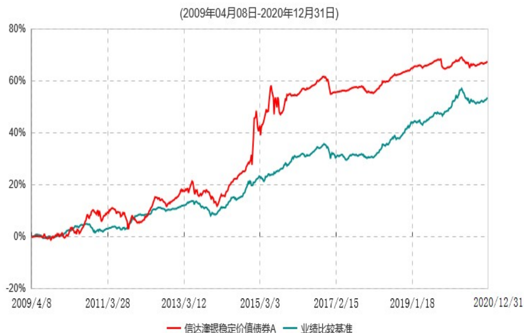
信达澳银稳定价值债券A累计净值增长率与业绩比较基准收益率历史走势对比图