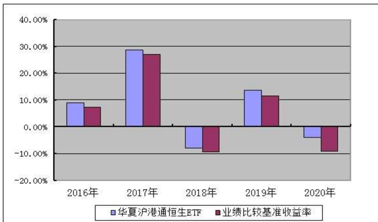
华夏沪港通恒生交易型开放式指数证券投资基金 基金每年净值增长率及其与同期业绩比较基准收益率的对比图