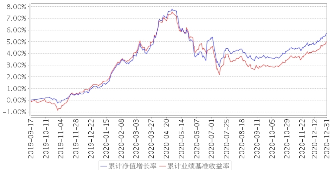
建信中债 5-10 年国开行债券指数 A 累计净值增长率与同期业绩比较基准收益率的历史走势对比图