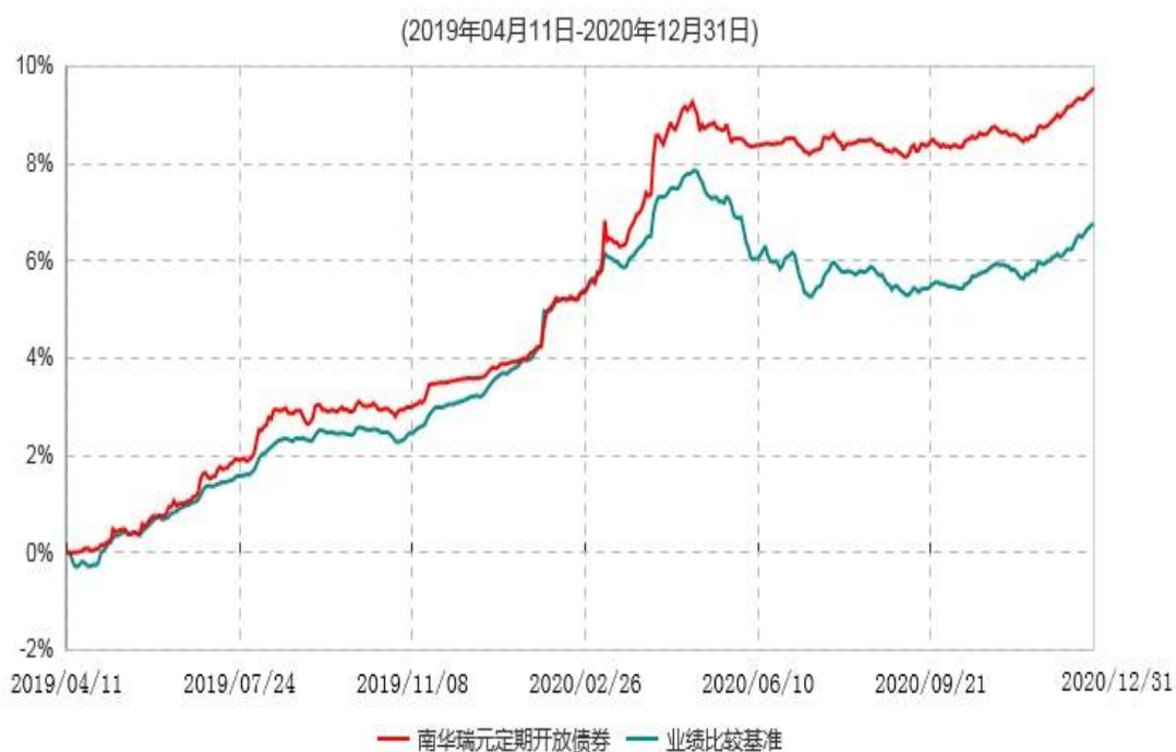
南华瑞元定期开放债券型发起式证券投资基金累计净值增长率与业绩比较基准收益率历史走势对比图