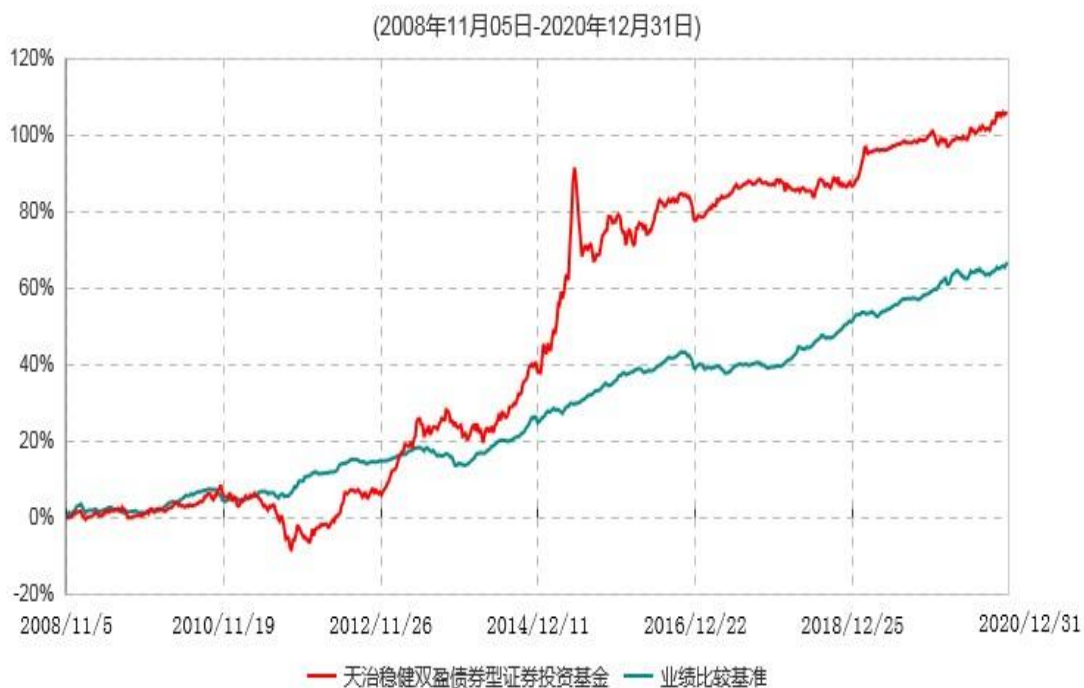
天治稳健双盈债券型证券投资基金累计净值增长率与业绩比较基准收益率历史走势对比图