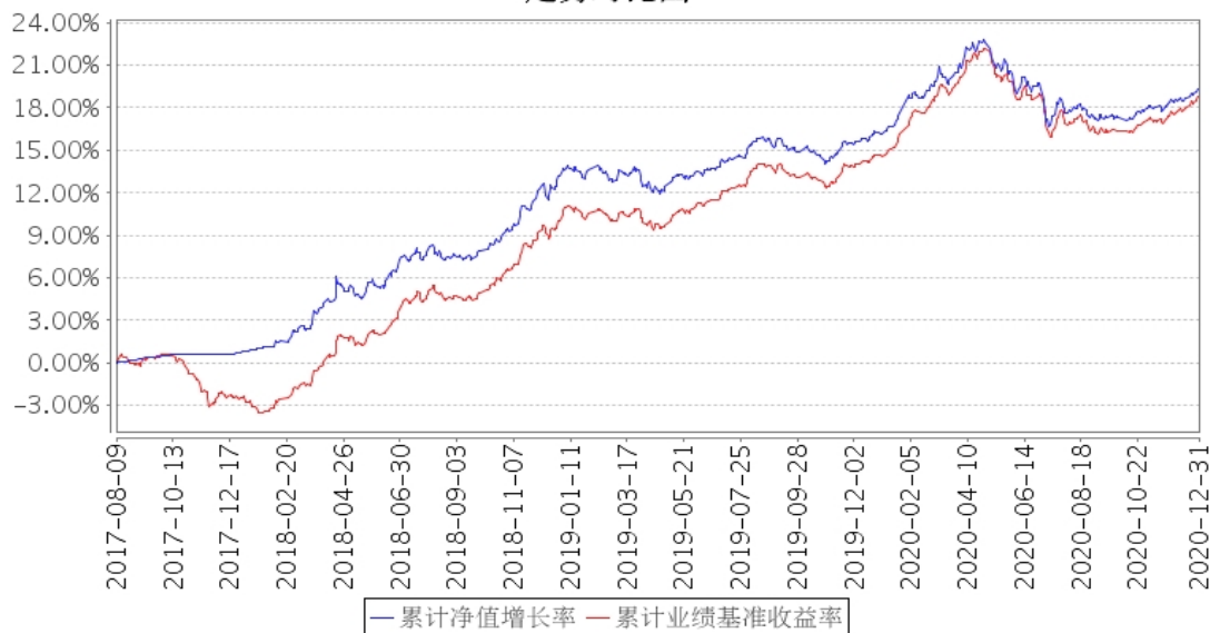
建信政金债8-10年指数 (LOF) 累计净值增长率与同期业绩比较基准收益率的历史走势对比图