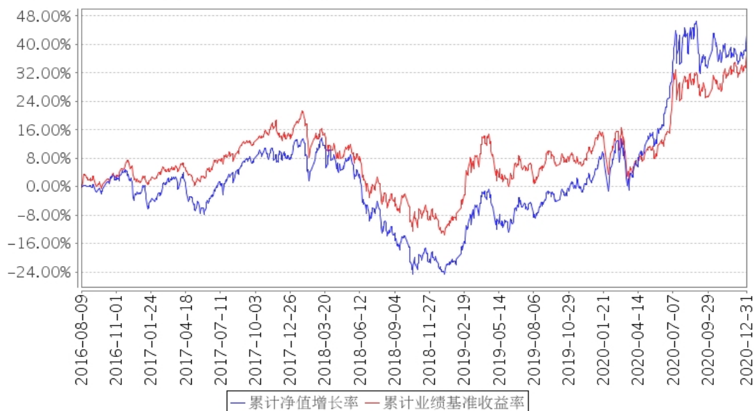
建信多因子量化股票累计净值增长率与同期业绩比较基准收益率的历史走势对比图