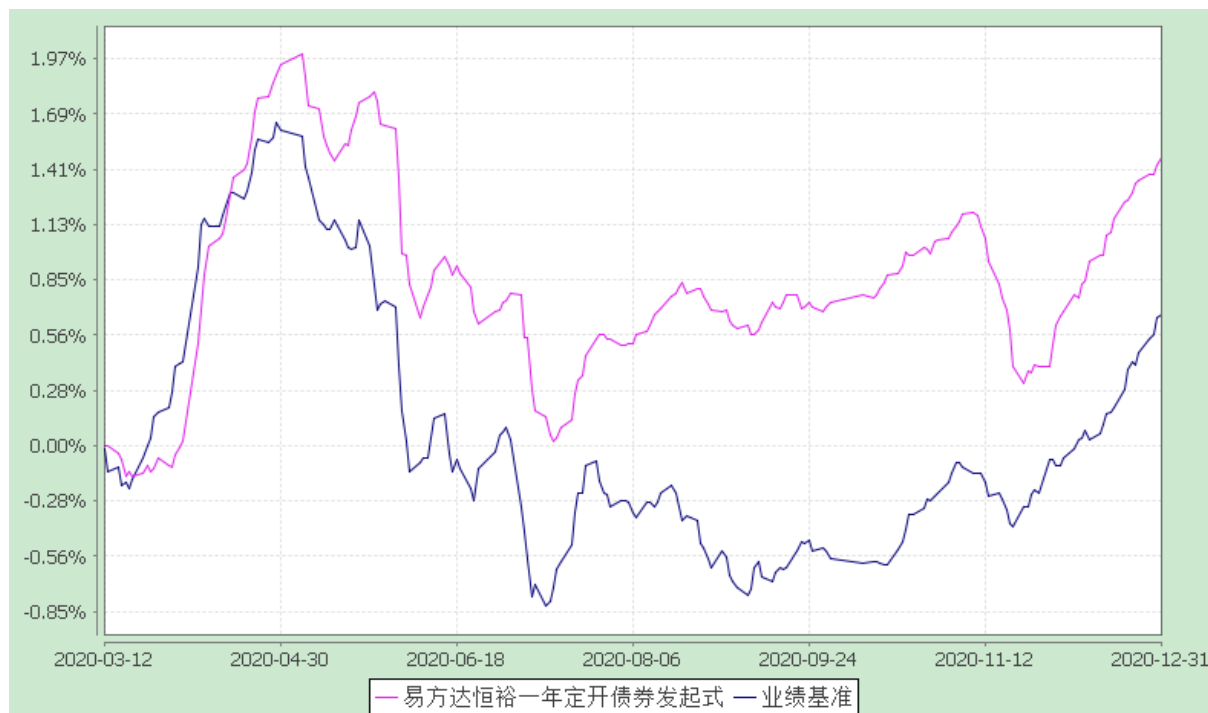
易方达恒裕一年定期开放债券型发起式证券投资基金 份额累计净值增长率与业绩比较基准收益率历史走势对比图 (2020 年 3 月 12 日至 2020 年 12 月 31 日)

注：1.本基金合同于 2020 年 3 月 12 日生效，截至报告期末本基金合同生效未满一年。