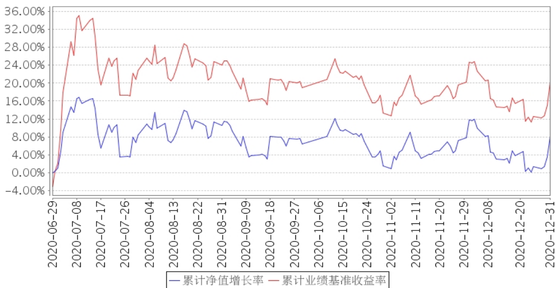
建信中证全指证券公司ETF累计净值增长率与同期业绩比较基准收益率的历史走势对比图

注：本基金基金合同于2020年6月29日生效，截至报告期末未满一年。本基金建仓期为6个月，