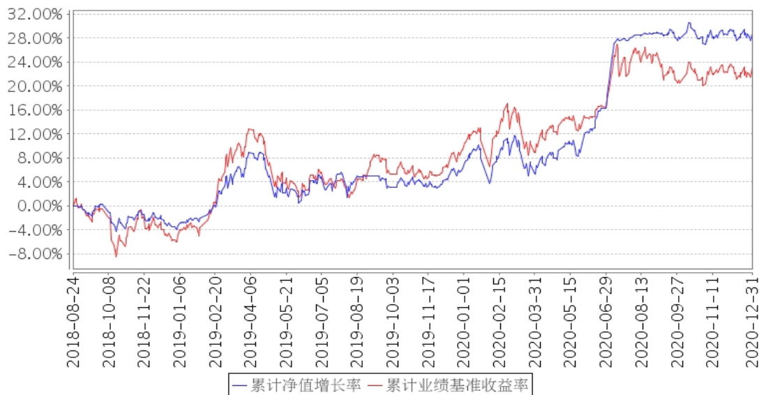
建信量化优享定期开放混合累计净值增长率与同期业绩比较基准收益率的历史走势对比图